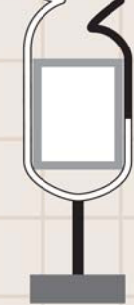
ツル型バス停 たんちょう鶴の かたちをしたバス停。 数は少ない。